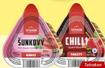
Šunkový nárez, Chili toasty 110 g