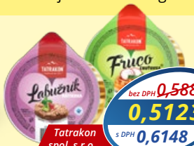
Fruco-chuťovka, Labužník jemný pečeňový krém 75 g