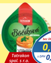
Böčiková nátiierka 120 g