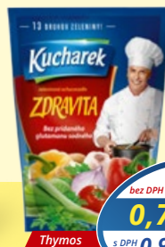
SK Zdravita ochucovadlo bez glutam. 200 g