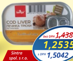
Tresčia pečň zn. Banga 115 g