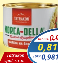
Morca-della omáčka na špagety 190 g