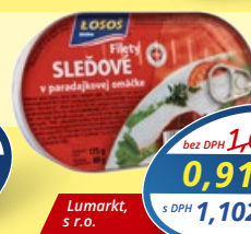
LOSOS Filety sledové v paradajkovej omáčke 175 g