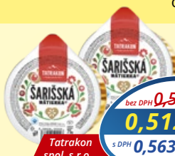
Šarišská nátiierka 75 g