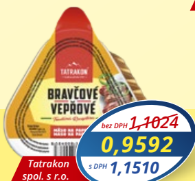
Bravčové na paprike 110 g