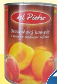
Broskyňový kompót DEL PIETRO plech 410 g