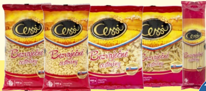
CESSI bezvaječné cestoviny Penne rigate, Makaróny, Koliénka malé, Turbánky, Mušle malé 400 g