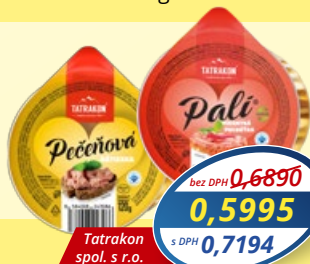
Pali pikantná mäsová nátiierka, Peceňová nátiierka 120 g