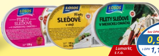
LOSOS Filety sledové v oleji, v paprikovej omáčke, v mexickej omáčke 170 g