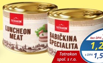
Luncheon Meat, Babičkina špecialita 190 g