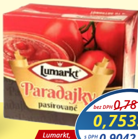
Paradijky pasírované LUMARKT 500 ml