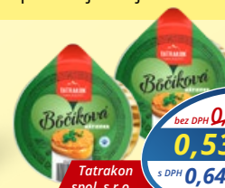
Böčiková nátiierka 75 g