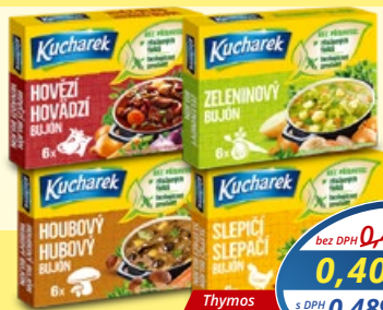
Kucharek slepačí, zeleninový, hovädzí, hubový bujón 60 g