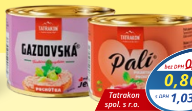
Gazdovská pochúťka, Pali pikantná mäsová nátiierka 180 g