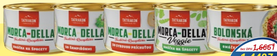
MORCA-DELLA omáčka na špagety, so šampiňónmi, so syrovou príchuťou, Veggie, Boloňská omáčka 400 g