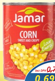
Kukurica JAMAR zrná 400 g