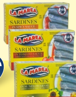
LA MAREA Sardinky v paradajkovej omáčke, v pikantnej paradajkovej omáčke, v slnečnicovom oleji 125 g